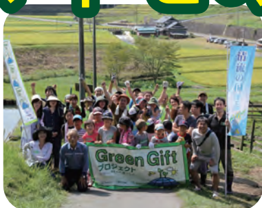
〈農作業の体験をします (サツマイモの収穫をします)〉