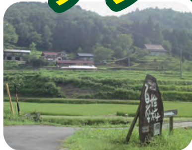
〈里地には自然がいっぱい〉