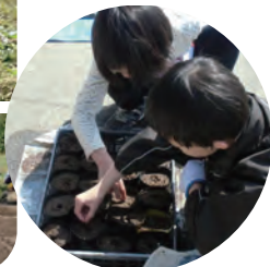
〈ポット苗をつくります〉