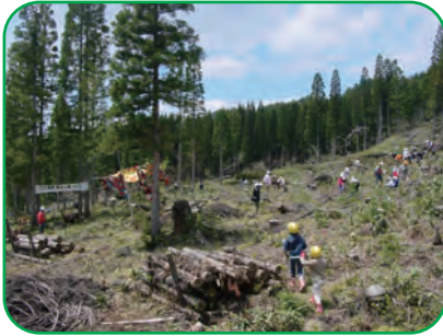
<広葉樹の森を育てましょう>