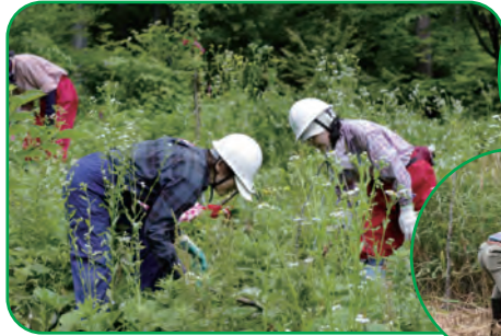
<植樹地の下草を刈ります>