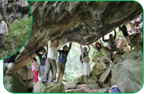
<大倉滝を見学します>