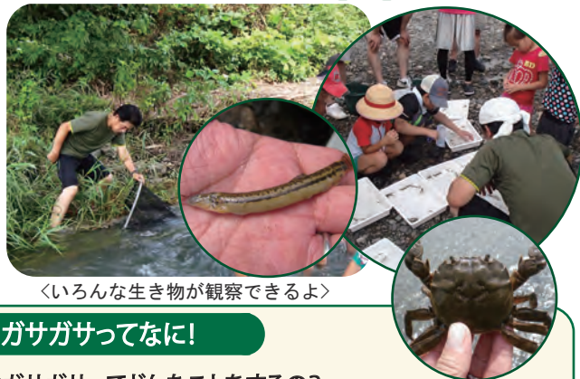
〈いろんな生き物が観察できるよ〉