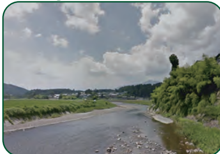
〈上石津の牧田川は自然がいっぱい〉