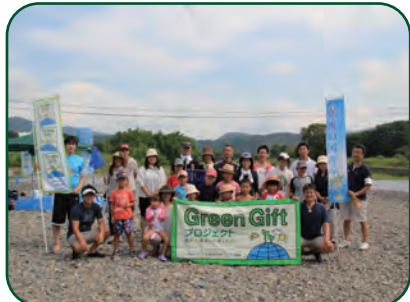
〈夏休みの思い出に参加しましょう〉