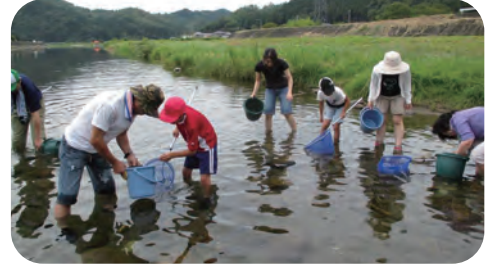
〈川の中の生き物を採取します〉