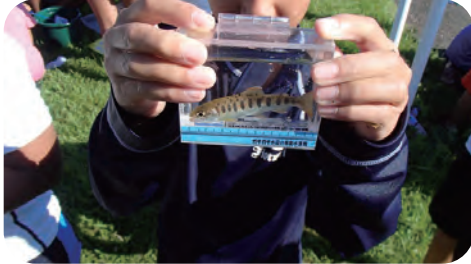
〈こんな魚も捕れるかも?〉