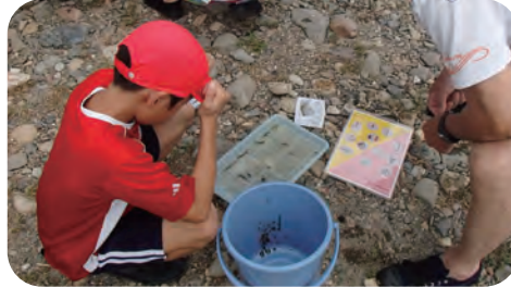
〈採取した水生生物は観察して分類します〉