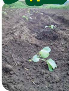
〈農作業の体験をします (じゃがいもの植え付け)〉