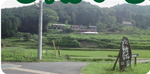
〈里地には自然がいっぱい〉