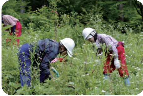
〈植樹地の下草を刈ります〉