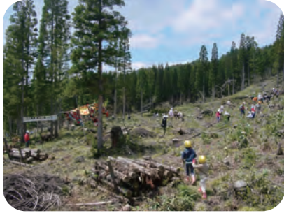
〈広葉樹の森を育てましょう〉