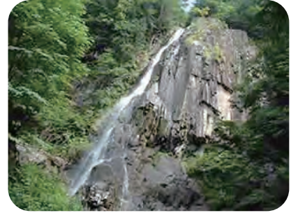
〈大倉滝を見学します〉