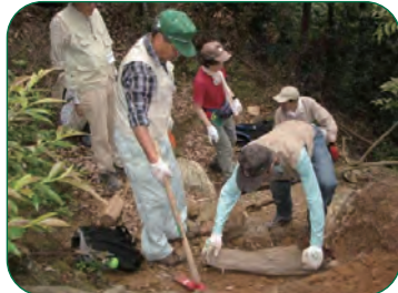
登山道整備/清掃活動を行います