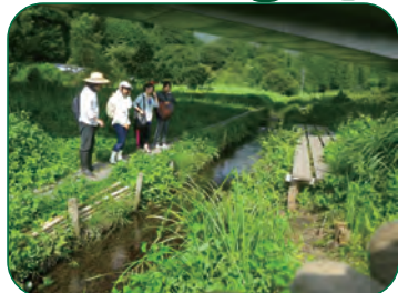
金華山の東側 達目洞の自然を満喫します