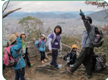
金華山の自然を学習します