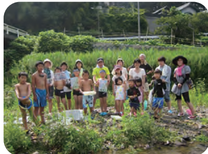
〈夏休みの思い出に参加しましょう〉