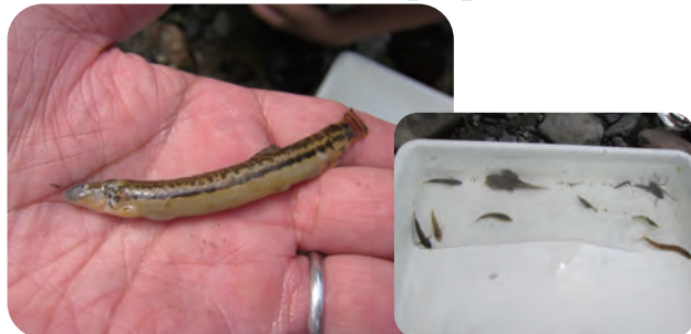
〈いろんな生き物が観察できるよ〉