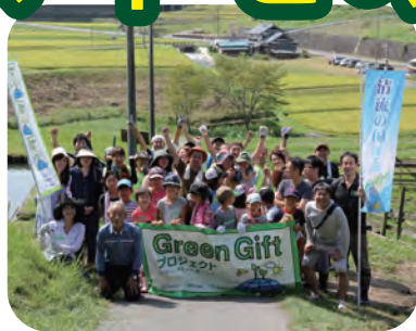
〈農作業の体験をします (サツマイモの収穫をします)〉