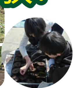
〈お楽しみプログラム〉