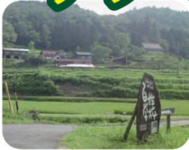
〈里地には自然がいっぱい〉