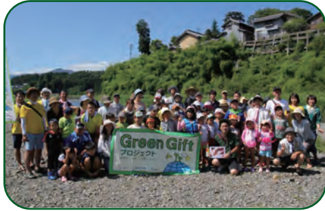
〈夏休みの思い出に参加しましょう〉