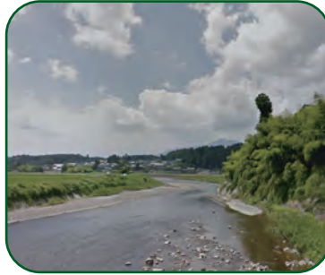
〈上石津の牧田川は自然がいっぱい〉